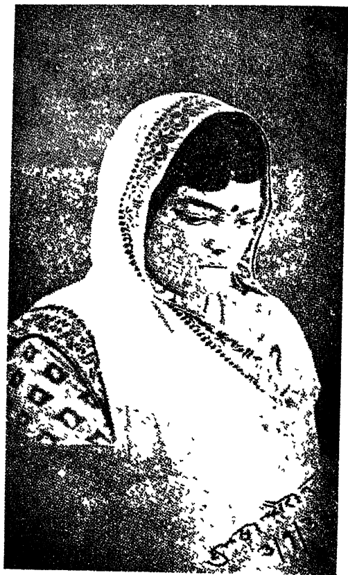
स्वर्गीया सभद्रा कुमारी चौहान